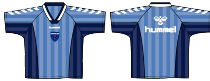
スクールウェア半袖シャツ

※価格につきましては、すべて税込となっております ※ご注文サイズに○を付けてください