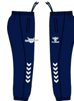
トレーニングパンツ