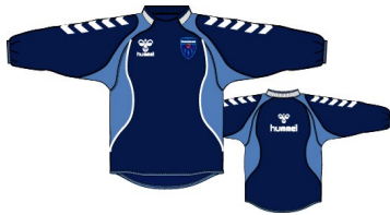
トレーニングジャージ