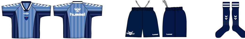
スクールウェア半袖、ゲームパンツ、ストッキング 3点セット